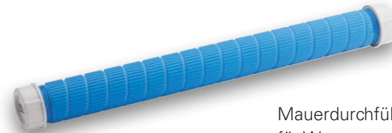
Mauerdurchführung für Wasseranschluss

Die Einsparten- hauseinführungen werden durch die Westfalen Weser Netz gestellt.